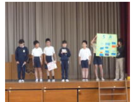
掲示委員会の発表

今年、全校集会で各委員会の活動内容や呼びかけを行う計画です。第1回は、掲示委員会が活動内容と校内に掲示してある掲示物をていねいに扱ってほしいとの呼びかけを行いました。また、企画委員会では「あいさつ」への呼びかけと練習を行いました。特に4年生以上には、見守りをしてくれている方へ感謝の気持ちを伝えるあいさつ「いつもありがとうございます」ができるように呼びかけていました。全校児童の前での司会進行や発表はドキドキでしたが、練習の成果が出て、よくできました。