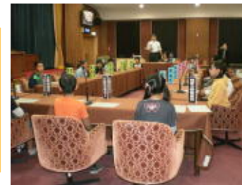
江戸東京博物館での見学

10月4日。秋晴れの中、待ちに待った東京遠足。笑顔いっぱい、たくさんの思い出ができました。