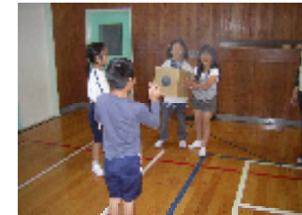
○暑い日が続いています。汗ふきタオル、着替えの用意をお願いします。