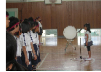
○サイエンスキッズ