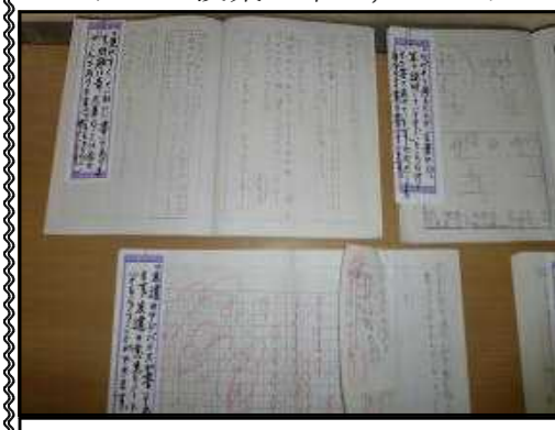
4年生のノート展から

子どもたちは、行事のたびに一回り大きくなったのを感じます。また、よいもの(手本となる上級生や友達の様子)を見た子どもたちはさらに伸びようとする意欲も感じ取ることができました。やはり、子どもたちはすばらしいですね。