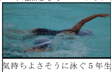
気持ちよさそうに泳ぐ5年生