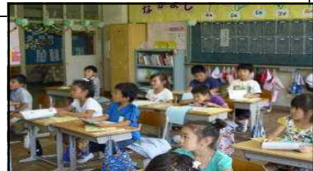
夏休みの生活について話を聞く1年生

また、自転車に乗ることが多くなったり、ショッピングセンターや水辺に行くことも増え、交通事故等の危険性が高くなります。子どもたちにとって、安全で有意義な夏休みを送るために全体で、学級で次のような話をしました。