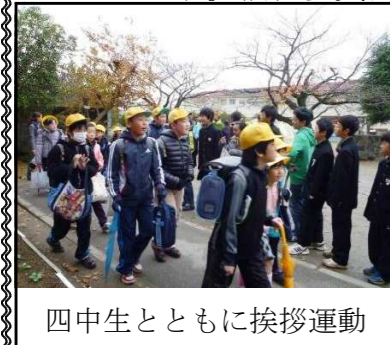
四中生とともに挨拶運動

ボトルのキャップを集める活動を計画し、実践しています。福祉委員会の活動としては、水曜日(清掃がない日)の階段掃除、毎朝の傘立ての整頓も行っています。また、土浦第四中学校からの呼びかけで、「黄色いリボン運動」(いじめをしない、させない、許さない)、12月は中学生のお兄さんお姉さんと合同で朝の挨拶運動を行いました。