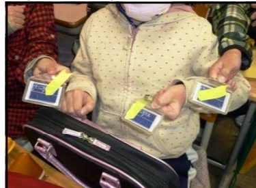
名札に付けた黄色いリボン

「あたりまえのレベルをアップしよう」で始まった2学期。子どもたちなりに今の「あたりまえ」のレベルを考え、それをさらにアップさせようがんばりました。「5分前行動」「あいさつ」においては、企画委員会やボランティアを中心に、全校児童に呼びかけることができました。また、「黙働」を徹底しようと、美化委員が率先して清掃に取り組みました。美化委員は、毎朝、昇降口のモップかけもやってくれています。福祉委員会では、今までの募金活動だけでなく、ペット