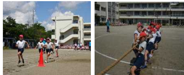
< TANKYORI >

6月1日(火)にスポーツフェスティバルが開催されました。リモートによる開閉会式、2学年ずつに分散して行う等、感染症対策行いながらも昨年よりレベルアップしたフェスティバルとなりました。4年生の種目は「TANKYORI」(徒競走)と「TSUNAHIKI」(綱引き)です。一生懸命競技に取り組んだり、友達を応援したりする姿はとても輝いていました。初めての係の仕事にも熱心に取り組みました。