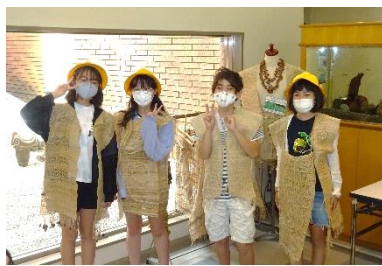
縄文時代の衣類はこんな感じ？