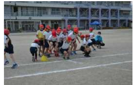
3年「ウルトラ☆ハリケーン」で息を合わせてジャンプ！

□ ● △ ■ ○ ▲ □ ● △ ■ ○ ▲ □ ● △ ■ ○ ▲ □ ● △