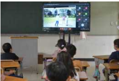
2年生が，VTRで遊びのきまりについて具体的に学んでいます

「小学生のための非行防止教室」を実施しました。茨城県警察本部少年サポートセンターの方により，全ての児童が安全に安心して生活できるように，身近な問題を取り上げて，具体的にご指導いただきました。その内容は，児童の発達段階に応じて精選して，①低学年では”きまりをまもろう”というテーマで，遊ぶときの注意点やインターネットの使い方などについて，②中・高学年では”犯罪にまきこまれないために”というテーマで，インターネットの危険性について教えていただきました。さらに，全学年で「いじめ防止」についてもご指導いただきました。この学習を生かして，全ての児童が安全に生活できることを願っています。