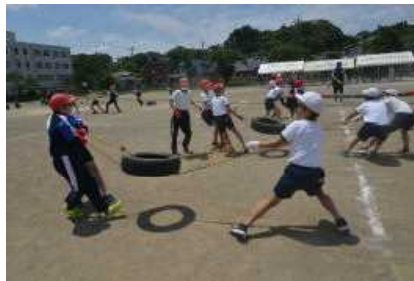
6年「最後なので，全力で引かせてください！」の様子