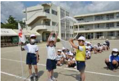
2年「ちびっ子台風」のゴールの様子

参観していただいた何人かの保護者の方から，「昨日の運動会ありがとうございました。がんばっている姿にとっても感動しました。」などというお話をいただきました。参観していただいて本当によかったと感じました。今後も感染症対策などを工夫・改善して子どもたちの様子を保護者の皆様に届けられるようにしていきたいと思ひます。